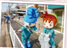
毎月2回 役員全員が店舗周辺のゴミ拾いに取り組んでいます