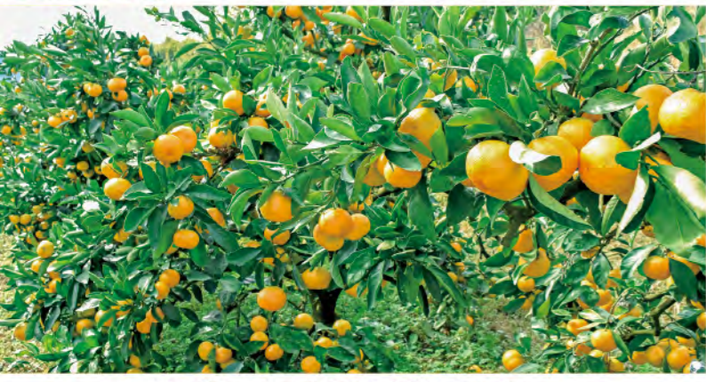
太陽の光をたくさん浴びた色鮮やかなミカン