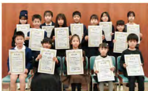
おめでとうございます

11月8日に当JAの審査会での特別賞受賞者の表彰式を行いました。 11月24日には愛彩ランドで「アグリFesta」を実施。食農教育功労者への感謝状贈呈式や、愛彩ランド女性出荷者PR、地元高校ダンス部によるパフォーマンスなど、盛り上がりがありました。 11月24日には愛彩ランドで「アグリFesta」を実施。食農教育功労者への感謝状贈呈式や、愛彩ランド女性出荷者PR、地元高校ダンス部によるパフォーマンスなど、盛り上がりがありました。