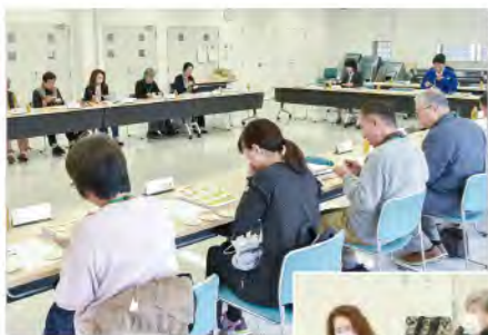
地元産米を食べ比べる

11月15日、准組合員の意見を伺いJA経営に生かすことを目的に第3回准組合員ミーティングを開催。15名が参加しました。今回は「JAのお米・魅力ある直売所について」と題し、担当職員が説明を行いました。 当JAでは地元産米(エコ米)の生産拡大に取り組みしており、令和7年度から「いずみの恵み」と名付け、浸透させていきたいと話し、参加者には地元産米の代表的な3品種を食べ比べていただきました。また、愛彩ランドは地元農家の出荷商品が全体の約83%を占めており、新鮮で安全・安心な農産物を消費者に提供していることなどを説明しました。