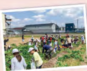
和泉支店は地元幼稚園・小学生に農業体験を行いました

組合員をはじめとした地域住民とのつながりを深め、支店の事業やJA運営の活性化・円滑化を目的として「支店ふれあい委員会」を組織しています。