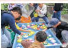
山直上支店では支店模擬店を開催! 地元産農産物の販売も行いました