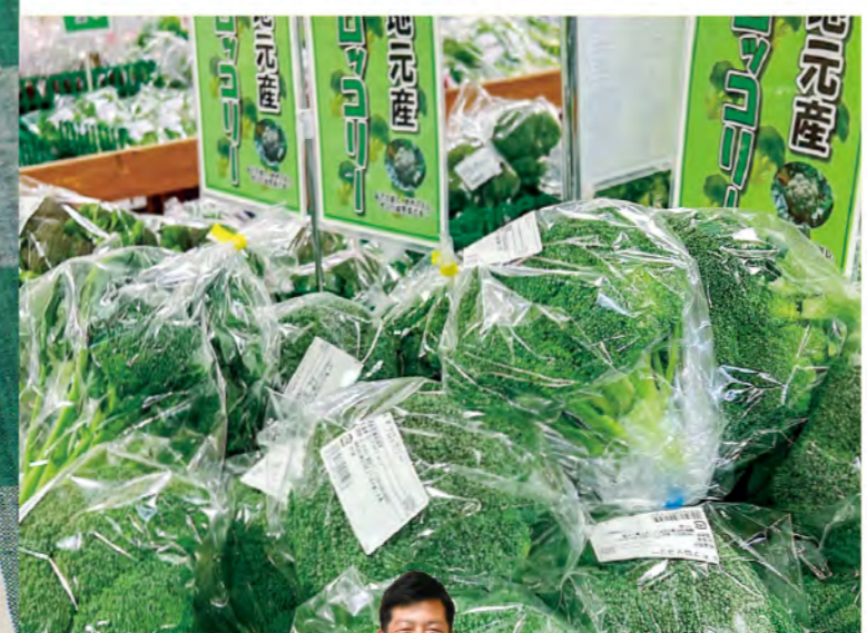
万代農産物直売所店長

おすすめは 「旬」のおすすめ 1月 ビタミンの宝庫ブロッコリーです! ビタミンCやβ-カロテンをたくさん含み、その量はキャベツの4倍といわれています! ビタミン類の損失を抑えるため、ゆでずに電子レンジで加熱するのがおすすめです。