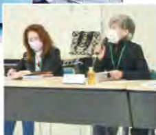
質問をする准組合員