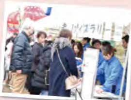
11月24日開催のマガリFestaではエコキャップ活動とエコ米クイズラリーを実施しました

組合員・地域の皆さまの豊かな暮らし作りを目指し、さまざまな地域環境保全活動に取り組んでいます。