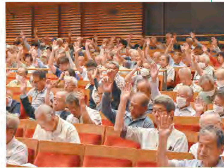
議案の採決を行う総代

J Aいずみのは地域農業の振興と、健康で豊かな地域社会の実現に向けて、さまざまな事業・活動を展開しています。地域に根ざしたJAの活動は、国連で採択されたSDGs（持続可能な開発目標）の達成にも通じるものです。