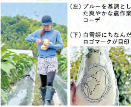
(左) ブルーを基調とした爽やかな農作業コーデ (下) 白雪姫にちなんだロゴマークが目印