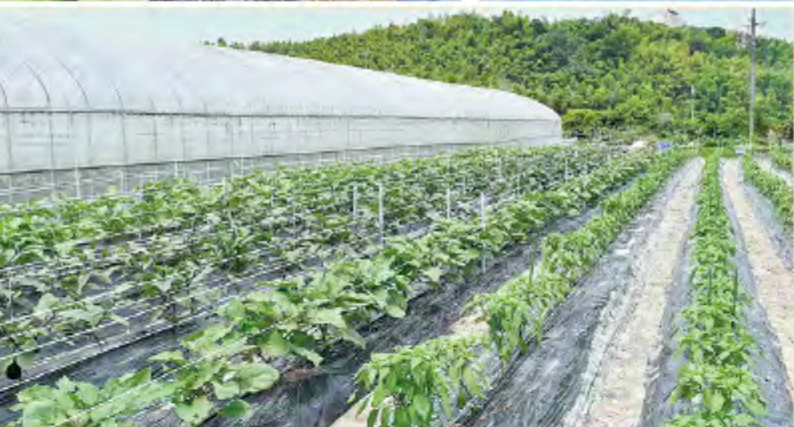
ハウスと路地の両方でナスを栽培し、育ち方の違いを実証中。路地では万願寺とうがらしなどナス以外の作物も栽培する