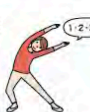
(4) 反対側も同様に行います。