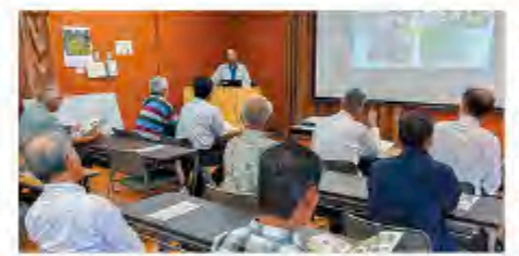
実行組合長代表者17名が参加

7月1〜2日、実行組合長代表者協議会は視察研修を実施しました。視察先の兵庫楽農生活センターは地域の企業、農家の協力のもと、さまざまな体験や教室を開き、農業振興に取り組んでいる施設です。担当者から講義を受けた後、施設を見学。終了後は活発な質疑応答や意見交換を行い、貴重な情報を得ることができました。