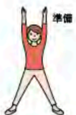
(1) 脚は肩幅よりも広く開いて立ち、両腕を上げます。