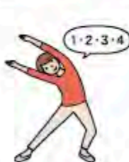
(2) 片脚を曲げながら、体側と首を同時にゆっくりと曲げ伸ばします。このとき、息を吐きながら行ってみましょう。