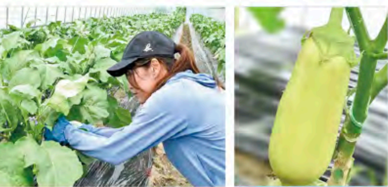
(右) 「万寿満茄子」はアクが少なく、やわらかい (左) トルコナスの花に「トマトトーン」(植物成長調整剤)を噴霧する