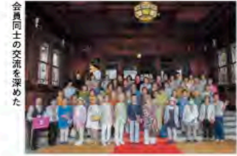
会員同士の交流を深めた

6月20日、55名が参加して、奈良県へ日帰り旅行に出かけました。郷土料理の柿の葉ずし作りを体験した後、ホテルでの昼食を満喫。このほか最後に奈良町散策で懐かしい景色を楽しみました。