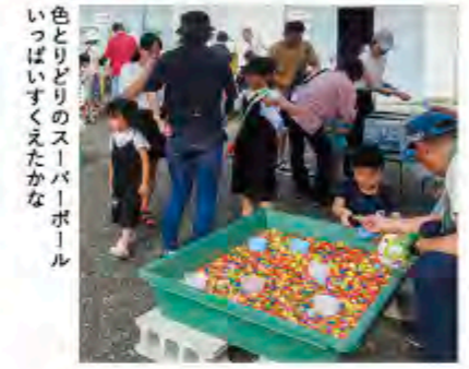
色とりどりのスーパーボールすくいすくえたかな

7月20日、夏祭りを開催。スーパーボールすくいやくじ引き、輪投げ、たこせんなど子どもたちは楽しい時間を過ごしました。土生郷支店、有真香支店、山滝支店、忠岡支店、北池田支店でもそれぞれ趣向を凝らしたイベントを開き、皆さんに喜んでいただきました。