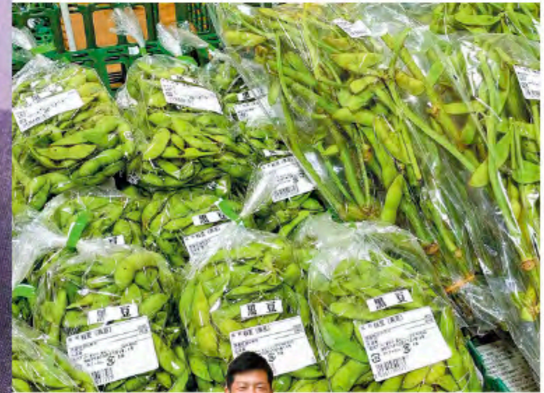
万代農産物直売所店長

黒枝豆は一般的な枝豆よりも、サヤと粒が極めて大きく、深みのある甘みとムチムチとした食感が特徴。じっくりと湯がいて豆本来の甘みとコクを味わってください。