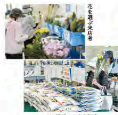
JA推奨のお米を販売

7月3日、いずみおおつ購買店舗が本格的にリニューアルオープンしました。苗や鉢植えに加え、仏花などの季節の切り花の販売も始めました。また、大阪府子ども食費支援事業第3弾の取り扱いも行っていきます（ヒノヒカリ3kg 10000円（税込））。ぜひご利用ください。